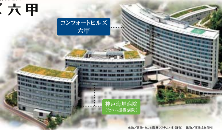
コンフォートヒルズ六甲